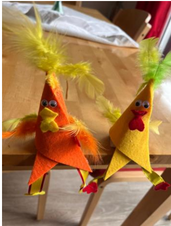
Wilde Hühner in Filz Handmade by Kreativprojekt